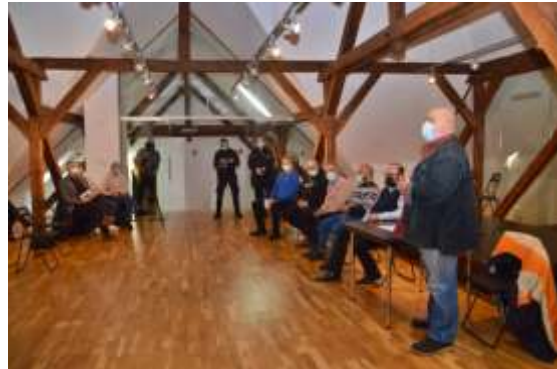
Proiectul Liter Art 2021 la Castelul Sâncraia. Lansare de carte.