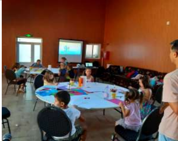
Proiectele vacanței 2021 la Căminul Cultural Ciumbud / Centrul de cultură.