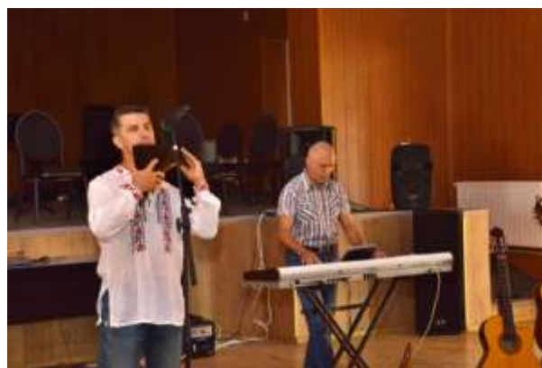
Colocviile de literatură și arte