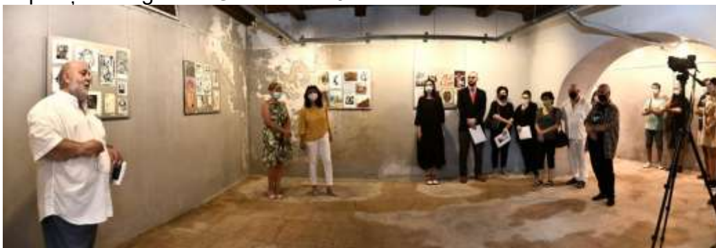
Expoziția Internațională de Mail Art