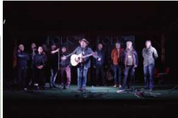
O seară de muzică folk