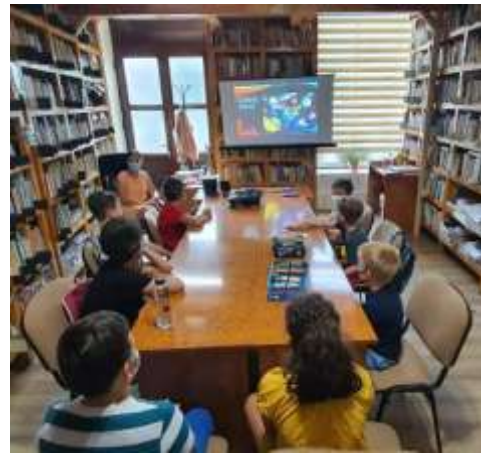
Enciclopedia de vacanță la Biblioteca Liviu Rebreanu