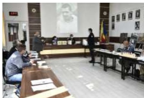
Proiect Liter Art în Penitenciarul Aiud