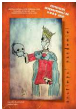
Festivalul Internațional de Umor, proiect stradal și online