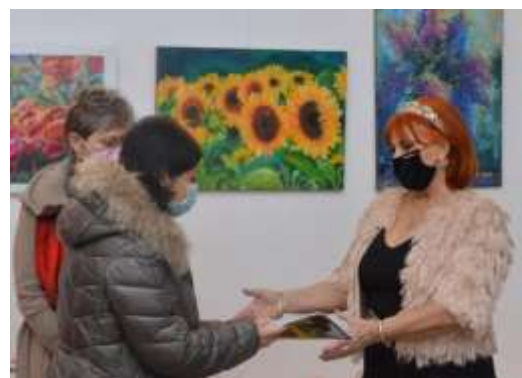
Expoziția de artă plastică. Sărbătoarea Dragobetelui.