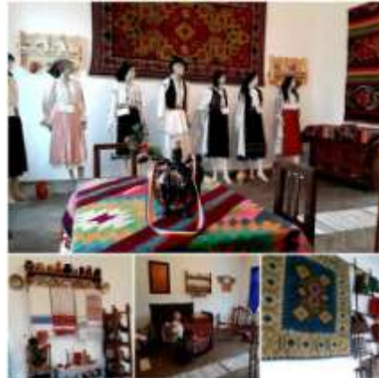
Expoziția etnografică Gârbova de Jos.