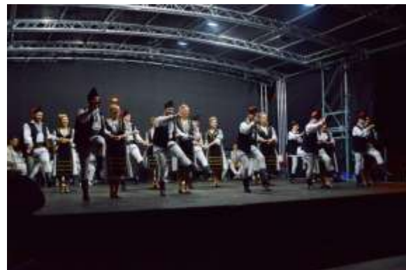
Ansambul Folcloric Doina Aiudului. Serbările Aiudului 2021.