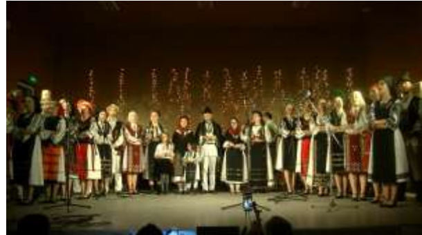
Concertul de colinde al Ansamblului Doina Aiudului