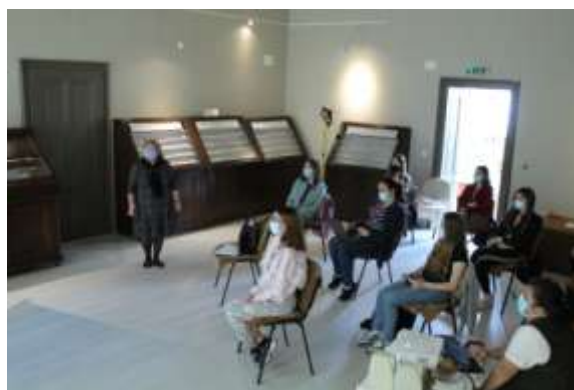
Proiecte de vacanță la Muzeul de Științele Naturii Aiud