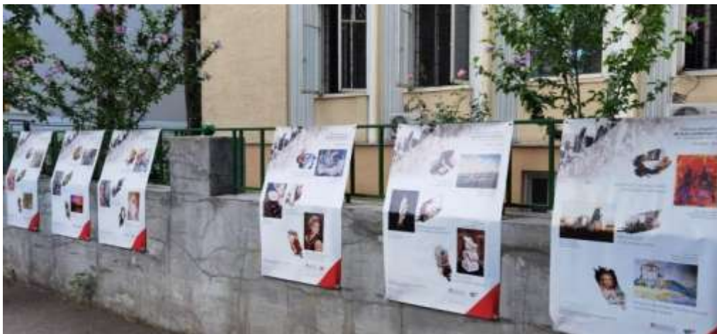
Expoziția Taberei Interetnice de Artă Contemporană la DRI, București