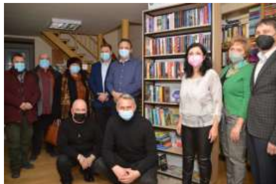
Raftul Bibliotecii Județene Lucian Blaga Alba la Aiud